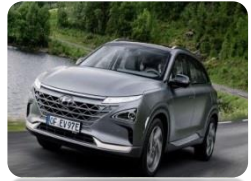
Véhicules de service