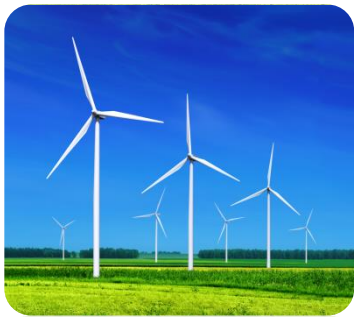
Parc éolien de Bouin

Territoire producteur et distributeur d'hydrogène vert pour des usages zero CO2